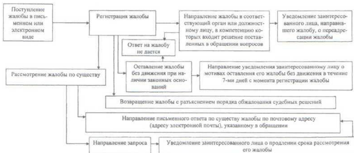
Рис. 12.2. Блок-схема рассмотрения жалоб на решения или действия (бездействие) органов ГПН и их должностных лиц

Порядок рассмотрения жалоб на решения органов ГПН приведено на рис. 12.2.