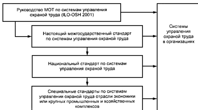
Рисунок 1 - Элементы национальных структур систем управления охраной труда

3.3.2 Элементы национальных структур управления охраной труда и связи между ними представлены на рисунке 1.